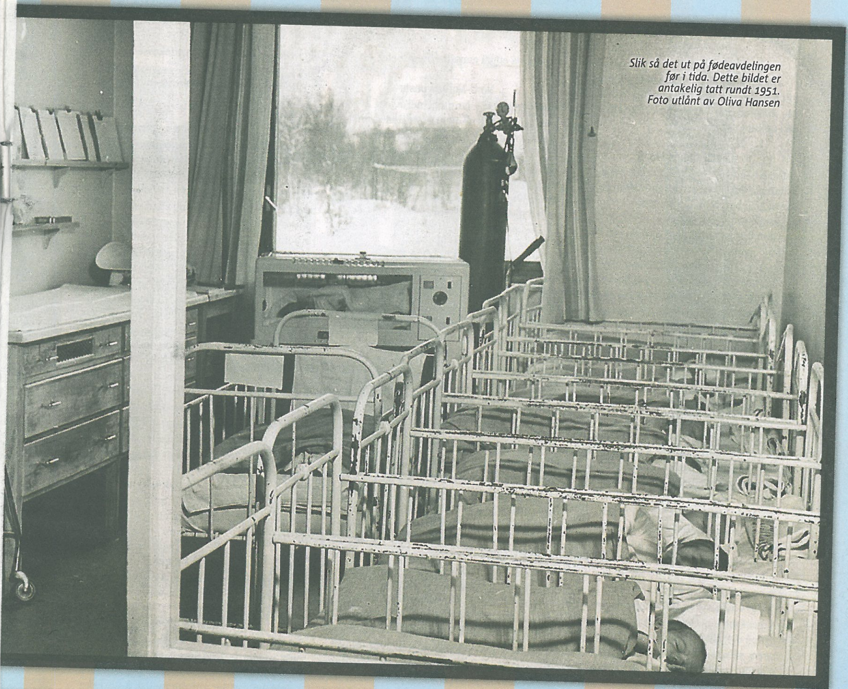
Slik så det ut på fødeavdelingen før i tida. Dette bildet er antakelig tatt rundt 1951.